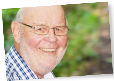
Das Interview führte Peter Schäuble.

Generell hatte der Methodismus in den Jahren seiner Gründungsphase unter Querschüssen der evangelischen Landeskirche zu leiden. Diese hat man nicht nur ausgehalten, sondern sich sogar dagegen durchgesetzt. Glücklicherweise hat sich die Haltung der Feindseligkeit bis auf den heutigen Tag zum genauen Gegenteil verändert. Im 1. Weltkrieg kam der Methodismus nicht ungeschoren davon. Es herrschte eine ausgeprägte England- und Amerika-Feindlichkeit, und die ließ man unsere Kirche mit ihren englischen Wurzeln spüren; der Methodismus wurde unverblümt ausgebremst. Über die Zustände während des 2. Weltkriegs existieren kaum Unterlagen; sicher ist, dass die Nazis alle Religionen, also auch die Methodisten teilweise massiv unter Druck setzten und diese organisatorisch – Stichwort: Parteimitgliedschaft – in ihre Ideologie zwingen wollten. Nicht selten ist ihnen das leider oft aus Existenzgründen der Betroffenen gelungen. Und es gab einige aus unseren Reihen, die sich sogar für den Nationalsozialismus stark gemacht haben.